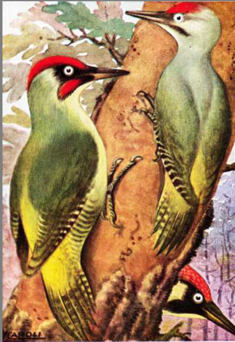
PICCHIO VERDE (a sinistra il maschio, a destra in basso la femmina) PICCHIO CENERINO (a destra in alto)