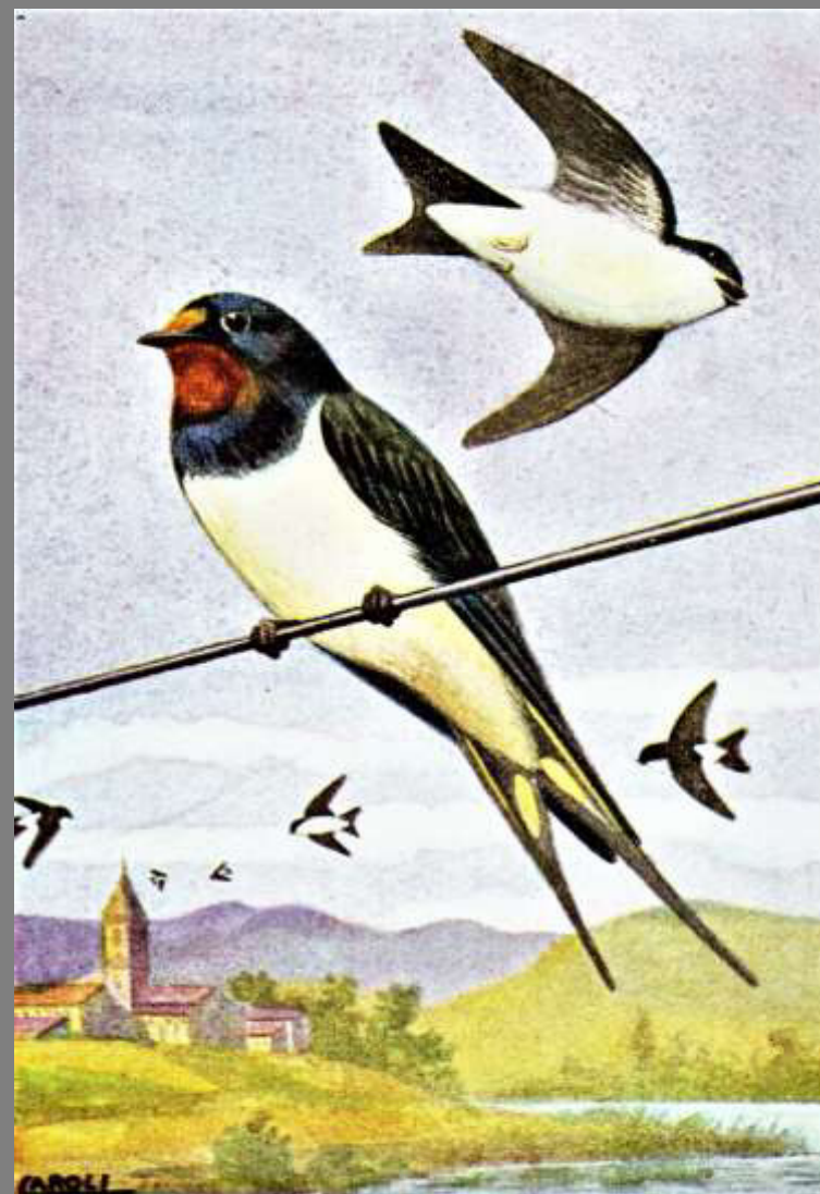
BALESTRUCCIO (in alto e in fondo) RONDINE (nel centro)