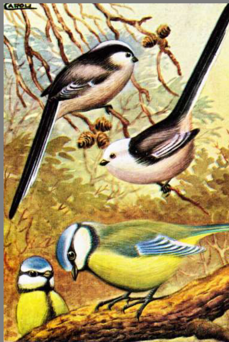
CODIBUGNOLO GRIGIO (a sinistra in alto) CODIBUGNOLO TESTA BIANCA (a destra in alto) CINCIARELLA (in basso)