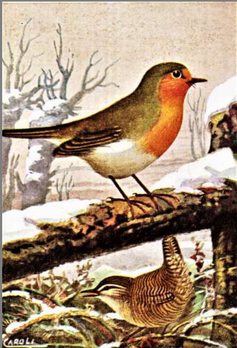
PETTIROSSO ( in alto ) SCRICCIOLO ( in basso )