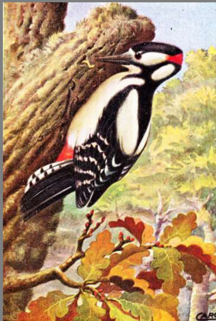
PICCHIO ROSSO MAGGIORE ( notachio )