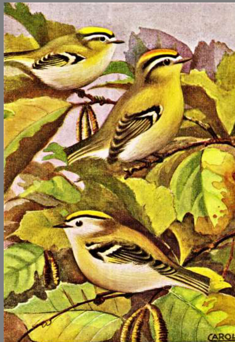
FIORRANCINO (a sinistra in alto la femmina, a destra il maschio) REGOLO (in basso)