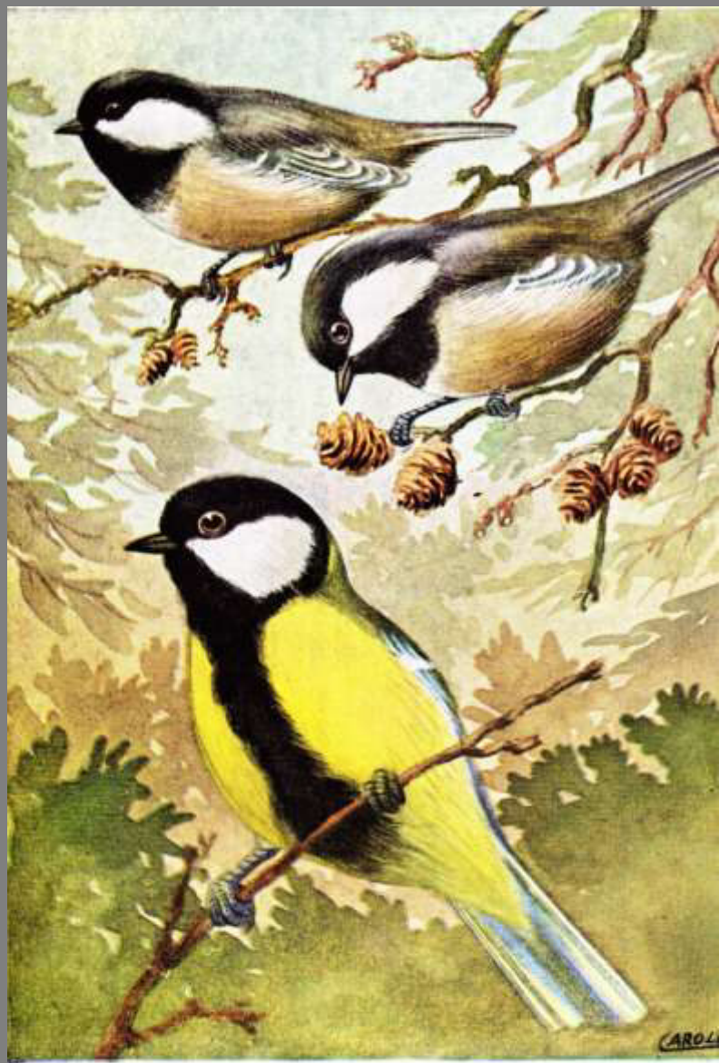
CINCIA MORA (in alto) CINCIALLEGRA (in basso)