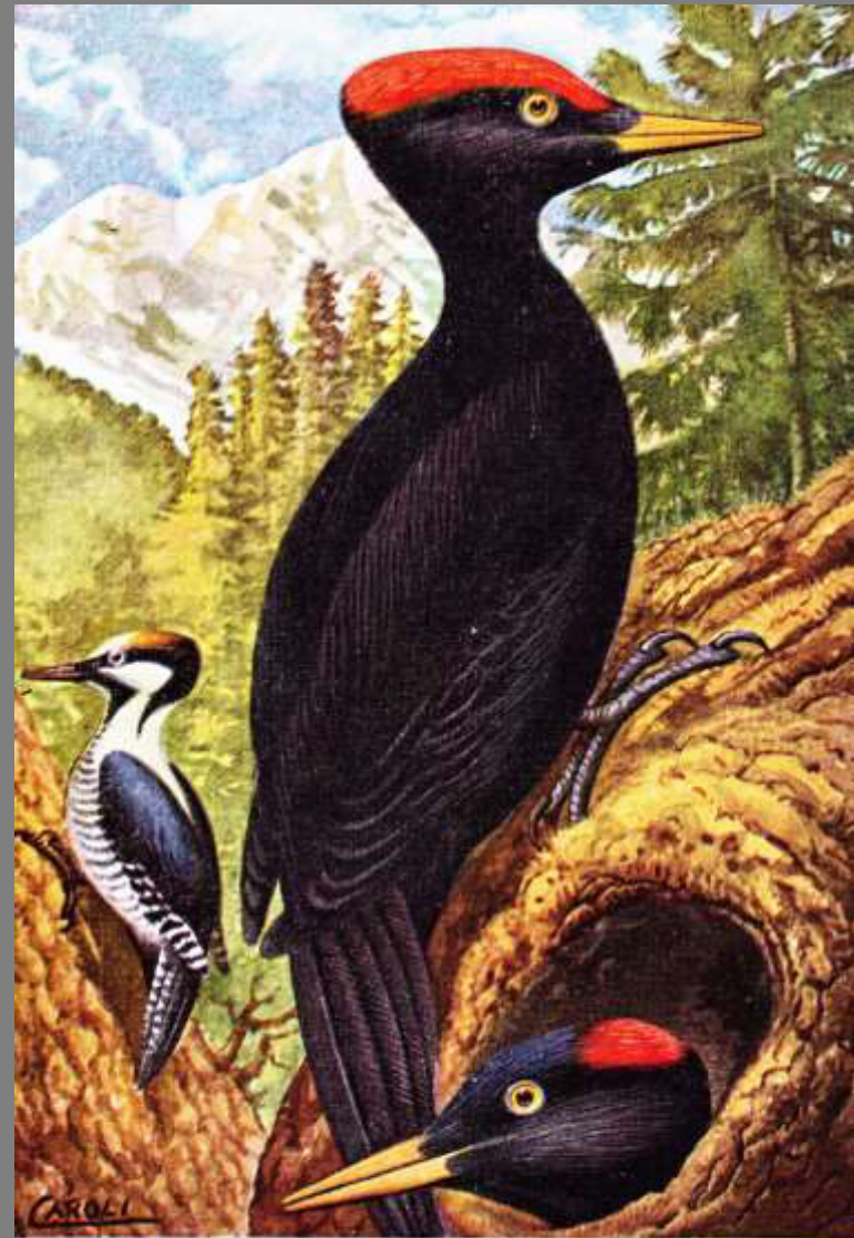
PICCHIO NERO (nel centro il maschio, a destra in basso la femmina) PICCHIO TRIDATTOLO (a sinistra in fondo)