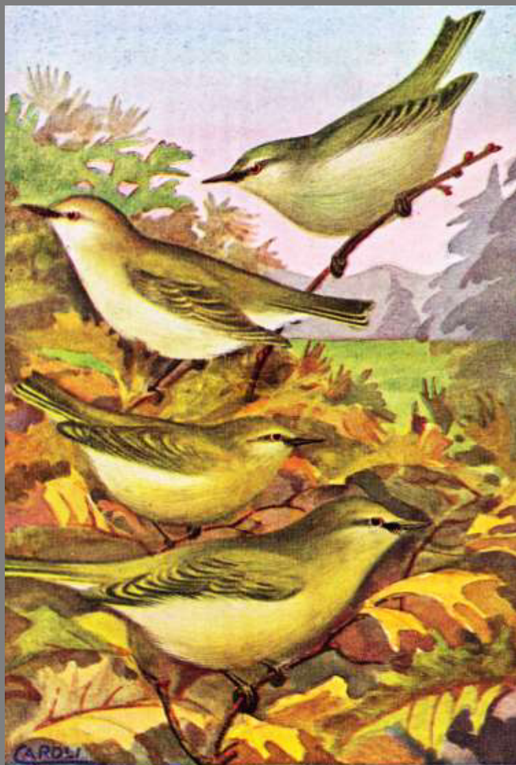
Dall'alto in basso: LUI VERDE, LUI BIANCO, LUI PICCOLO, LUI GROSSO