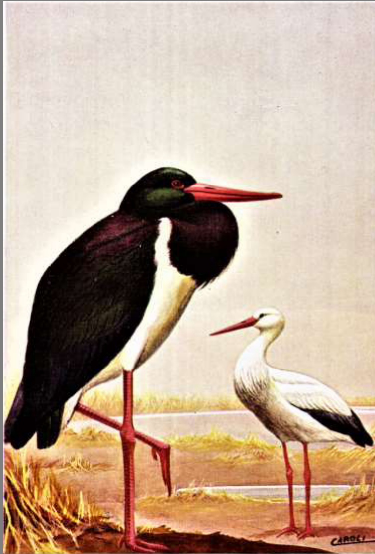
CICOGNA BIANCA (a destra) CICOGNA NERA (a sinistra)