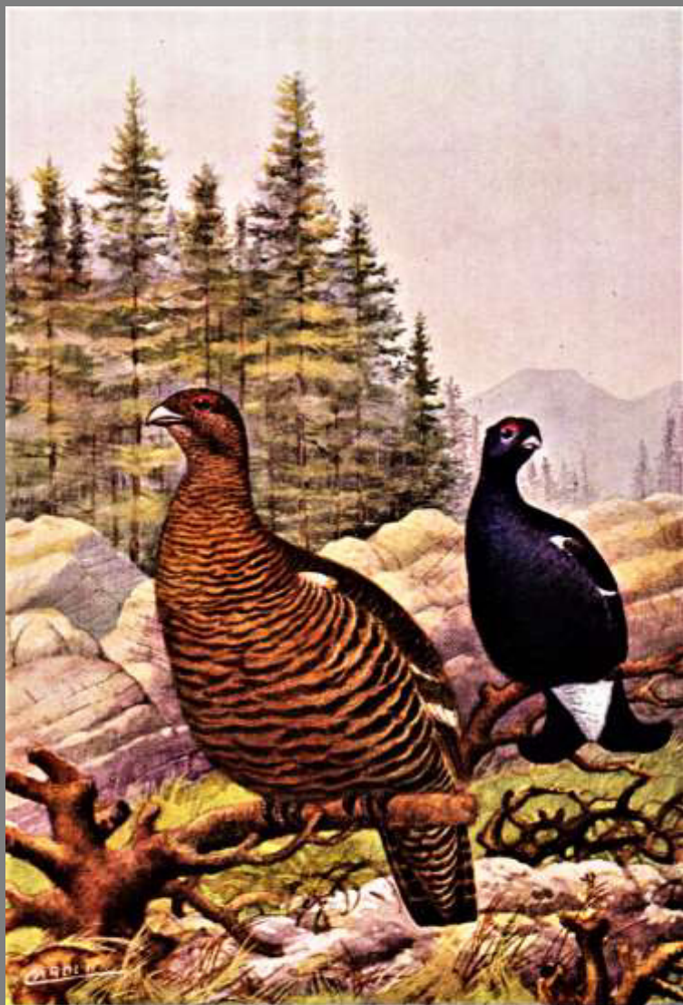
FAGIANO DI MONTE (a sinistra la femmina a destra il maschio)