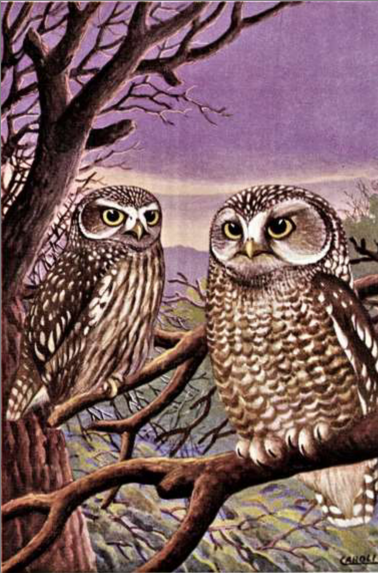
CIVETTA CAPOGROSSO (a destra) CIVETTA (a sinistra)