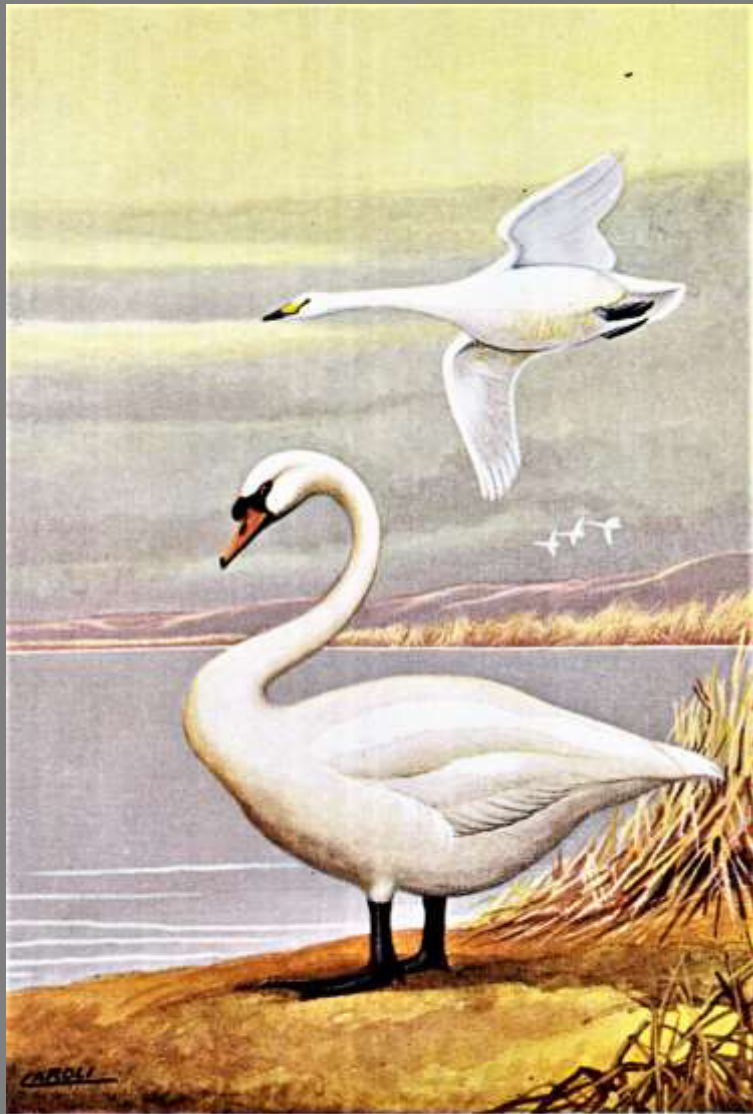
CIGNO SELVATICO ( in alto ) CIGNO REALE ( in basso )