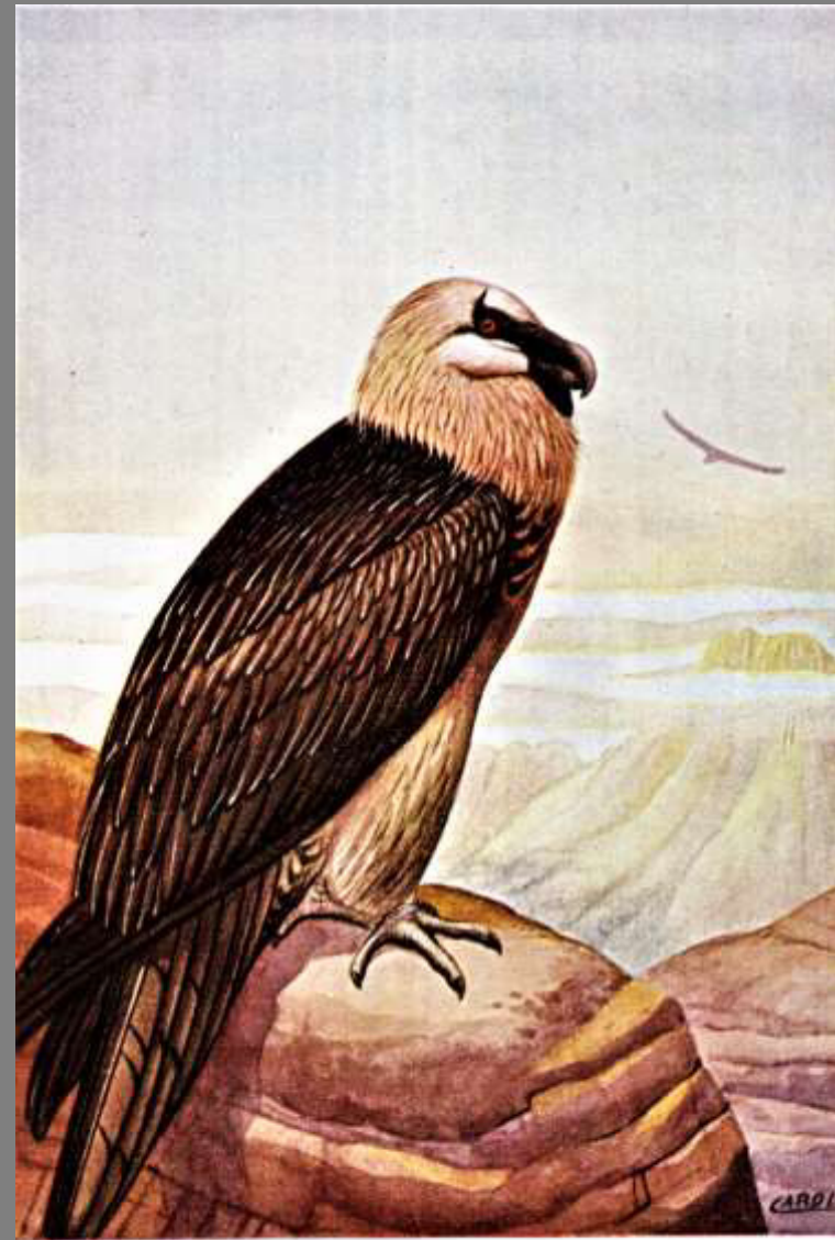
AVVOLTOIO DEGLI AGNELLI (adulto)