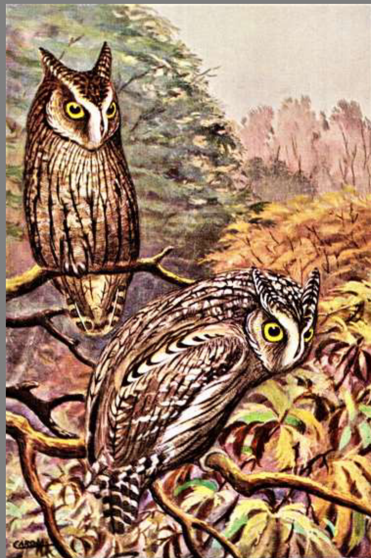
ASSIOLO (in alto la forma rossiccia in basso la grigiastro)