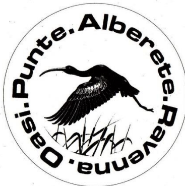
Fig. 2. Il primo logo dell'Oasi che raffigura la specie simbolo: il Mignattaio

Noi siamo oggi quel pubblico che da 47 anni gode ancora di questo piccolo paradiso, ed è nostro compito promuovere le iniziative ormai urgenti per rianimare la gestione di questo lembo di natura così faticosamente salvato dalle opere di bonifica integrale da chi ci ha preceduto. L'auspicio è che Punte Alberete torni ad essere un luogo favorito dal turismo naturalistico, un laboratorio per ricerche floristiche, faunistiche ed ecologiche da parte di studiosi italiani e stranieri, un ambiente dove i nostri giovani con i loro insegnanti possano osservare la natura, il primo passo per amarla e proteggerla.