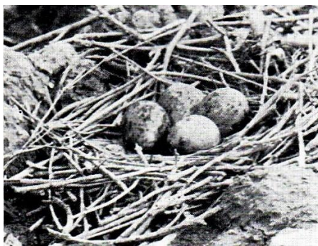
Nido di Avocetta, Valli di Comacchio, giugno 1960

I nidi delle Avocette, come risulta dalle nostre fotografie, sono prossimi a quelli dei Fraticelli, delle Rondini di mare e delle Rondini di mare dalle zampe nere, che in primavera si riuniscono in colonie sugli stessi dossi. Queste colonie risultano nei diversi anni, per cause molteplici non facilmente controllabili, più o meno numerose. Spesso il successo delle cove che avvengono dal maggio al luglio è compromesso da