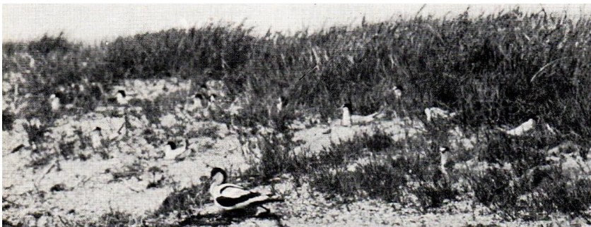
Avocetta in cova in una colonia nidificante di Fraticelli

Infatti gruppi costituiti da un certo numero di coppie nidificano nelle