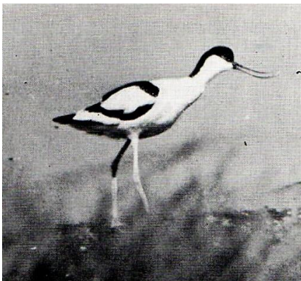
Avocetta in un dosso delle Valli di Comacchio, giugno 1960

L'Avocetta era già divenuta scarsa in Italia quando, sul finire del secolo scorso ed all'inizio del presente, furono pubblicate quelle inchieste e quei trattati che valsero