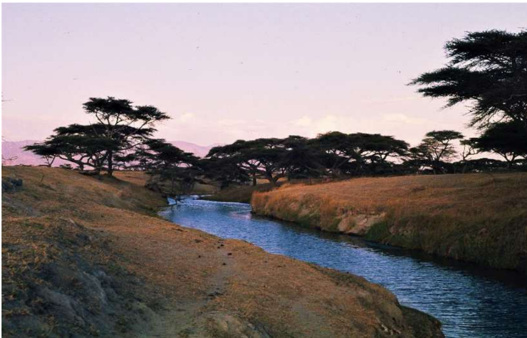
Un'insenatura del lago Abijata