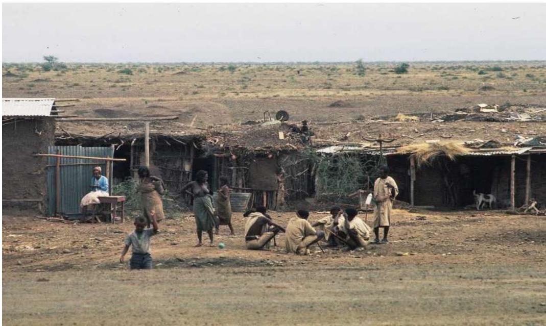
Il villaggio Hafar tra Gewane e Awash

Potrà sembrare poco credibile agli occhi di noi occidentali, ma a quei tempi, in quelle terre lontane da centri abitati, in assenza di stazioni di polizia col compito di sovrintendere il territorio, abitate da predoni e da un popolo bellicoso tutto poteva accadere.