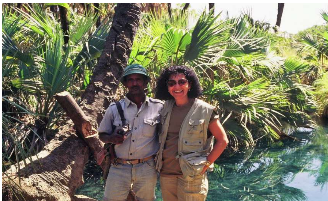
Nella terra degli Afar