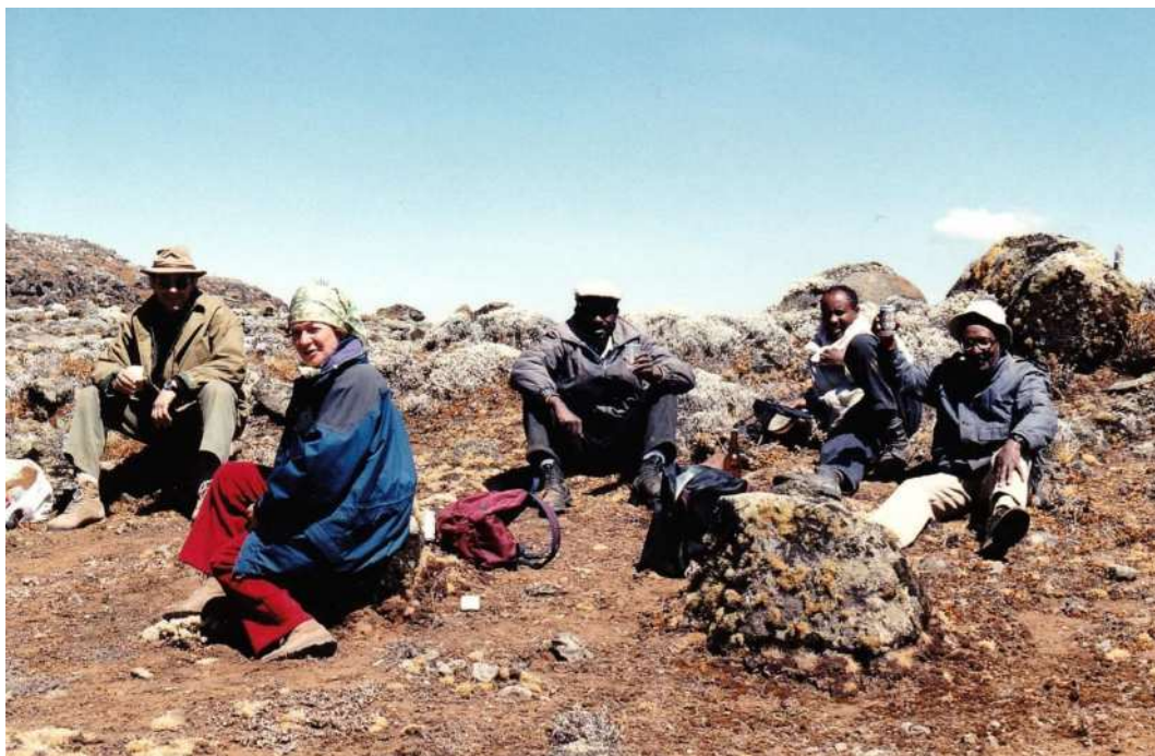
Alcuni protagonisti della battuta si stanno rifocillando

Prima di abbandonare la “mia” Africa voglio raccontare un ultimo episodio.