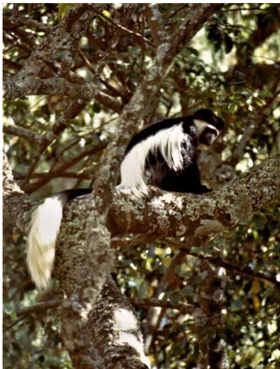
Guereza o Colobo abissino

In altra occasione, mentre attraversavamo una foresta nel Parco nazionale del Bale, mi sussurrò all'orecchio che non si spiegava la ragione di quei sacchetti di plastica bianca che ogni tanto vedeva numerosi sugli alberi. La confortai: la distanza non consentiva di vedere tra il fogliame le scimmie Guereza, ma le parti bianche del loro mantello ne tradivano la presenza. Mi ringraziò per la riservatezza con la quale le avevo risposto.