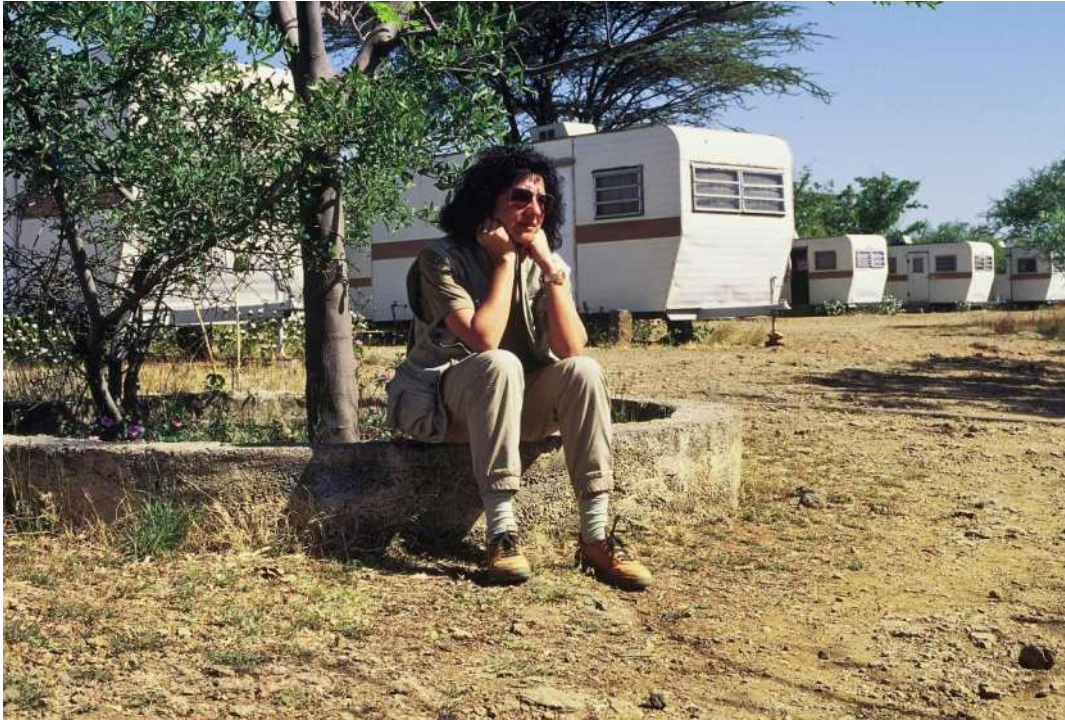
Il campo attrezzato per i turisti nel Parco Nazionale di Awash