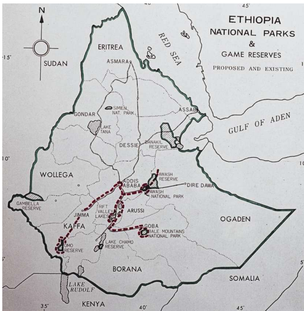
Il tratteggio in colore rosso indica l'itinerario compiuto

Ma veniamo ad alcuni episodi che intendo ricordare.