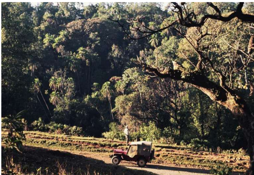
Verso il Parco Nazionale del Bale tra Shashamane e Dodola

Ma torniamo al nostro viaggio. Nei giorni successivi raggiungemmo il Parco Nazionale del Bale sulle montagne omonime, istituito soprattutto per la protezione del Niala di monte, poi percorremmo un lungo tratto della Rift Valley e rimanemmo colpiti dalla imponente fauna ornitica che popolava i laghi Langano, Abijata, Sciala e Auasa.