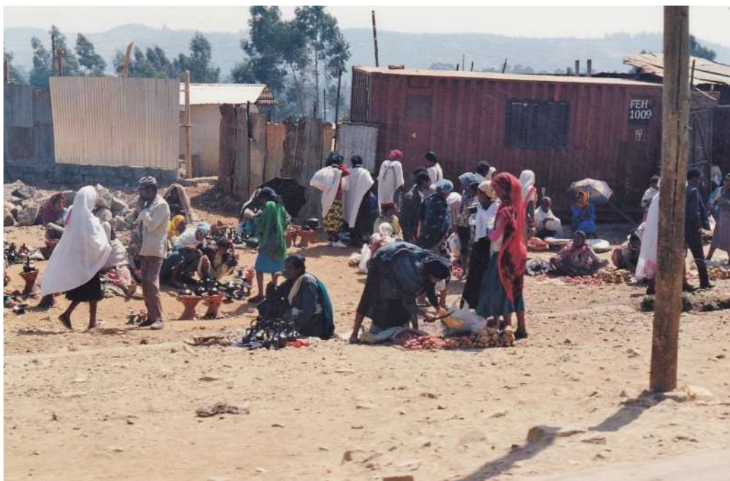
Un povero mercato alla periferia di Addis Abeba

È di tutta evidenza come questi tragici avvenimenti avessero causato esiti devastanti sull'economia dell'Etiopia e Addis Abeba ne manifestava gli effetti.