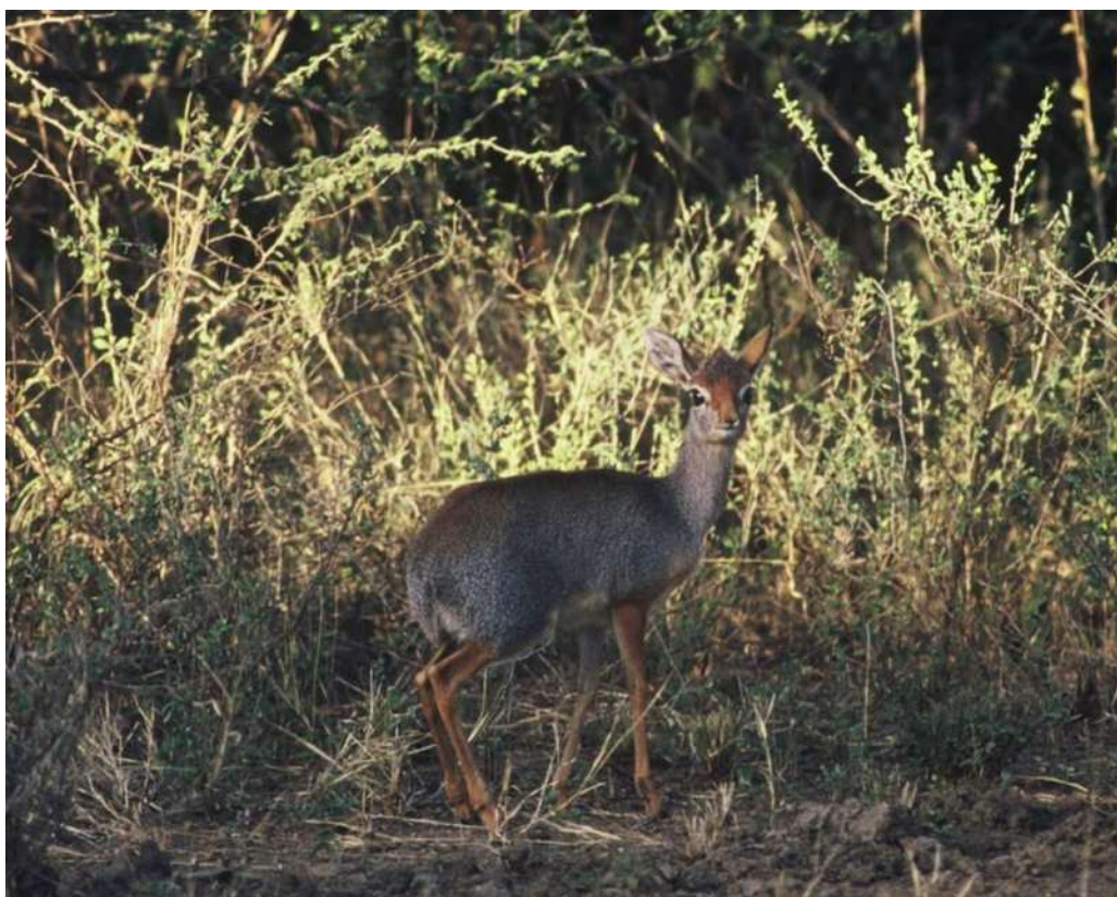
La fugace apparizione di una piccola antilope: il Dik dik

Anche in questo Parco non esisteva alcuna struttura ricettiva. In prossimità di un villaggio di capanne, ove risiedevano il direttore del Parco e alcuni guardiani con le rispettive famiglie, sorgeva un prefabbricato sprovvisto di adeguato mobilio e con solo alcune brande. Fu qui che, assieme all'agente di viaggi tedesco, venimmo alloggiati. La sistemazione era tutt'altro che confortevole, ma i disagi erano ampiamente compensati da quanto l'ampia savana, che si estendeva fino alle rive settentrionali del lago Rodolfo, offriva a dei naturalisti. Branchi di Bufali, Zebre, Elefanti, Alcelafi, Damalisch tiang, Kobi defassa, Orici, Antilopi alcine, Gazzelle di Grant, Oribi, Tragelafi, Dick-dick e qualche Giraffa. Il Leone era comune e nelle foreste a galleria erano numerose le scimmie Guereze.