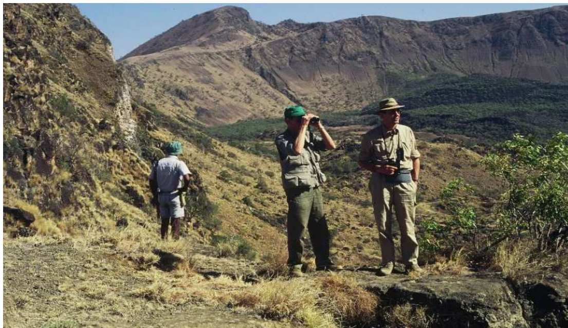
Sul bordo del cratere del vulcano nella Regione degli Afar

il vecchio fucile, ma altrettanto rapida fu la guardia con la sua arma. Furono momenti di vera tensione interrotti improvvisamente dalle urla di una donna non più giovane che correva nella nostra direzione. Parlò con voce decisa al giovane, che abbassò l'arma. Poi rivolse le proprie scuse alla guardia (io ovviamente non capii una parola di quello che disse, ma ne intuì lo spirito) e ci invitò a proseguire il nostro viaggio alzando la sbarra della strada.