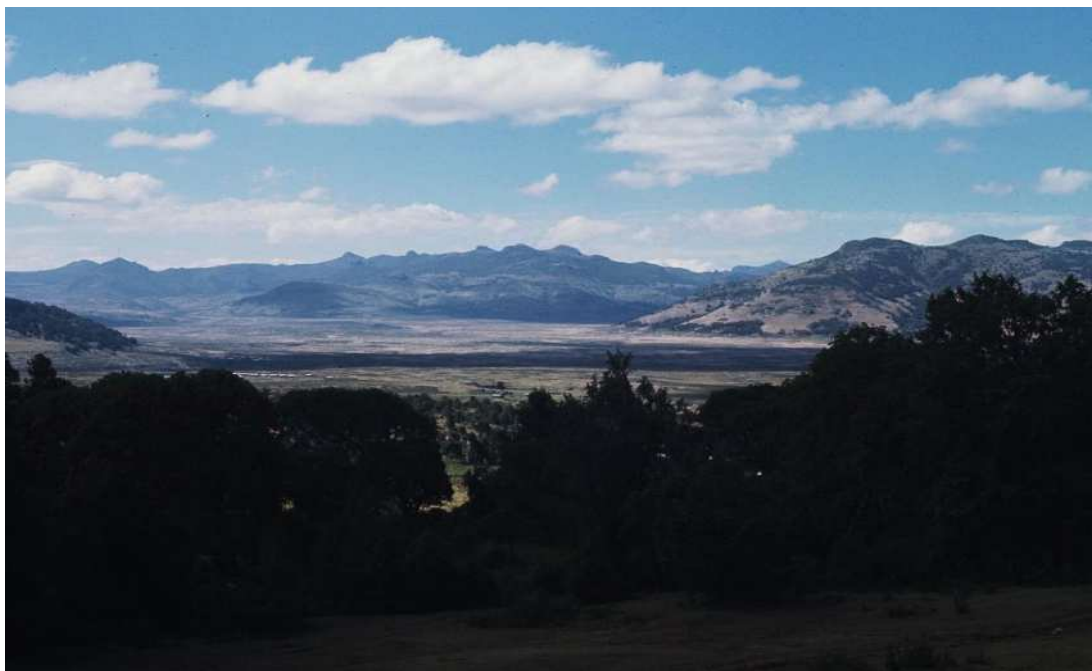
Nel Parco nazionale di Bale